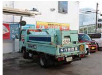
上：取材はセルフ八木山SSで行われた ／下：千代田商事名物の「コンコン車」。 冬季になると童謡の「雪」を合図に、利用客のもとに灯油が届けられる。車体カラーには、寒い地域（水色）を灯火（赤色）で温めるという意味が込められている