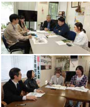
上：杵屋本店インタビューの様子。長い歴史から新しい施策まで、たくさんのお話をお聞きました／下：千代田商事インタビューの様子。熱意のこもったお話に、感銘を受けた

今号は私たち文芸学科の学生4名が担当しました。初めての取り組みにワクワクしながらも、インタビュウ中はやっぱり緊張。しかし同じ大学の卒業生ということで、学生生活の懐かしいトークで盛り上がり、和やかな雰囲気の中で取材をさせていただきました。企業さんの歴史や取り組みについてもお聞きでき、山形ならではの地域のつながりや温もりを感じる事ができました。この貴重な経験を糧に、今後もステップアップしていきたいです。(満)