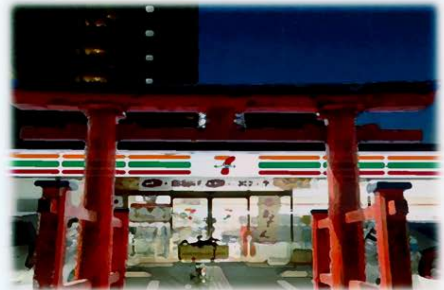
神社をコンビニのような身近な存在に…