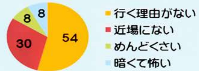
神社に行かない理由 (100人にアンケート)

参拝者が増え、神社が活性化する ことで、神社を通じた地域の人々の 繋がりが深まる